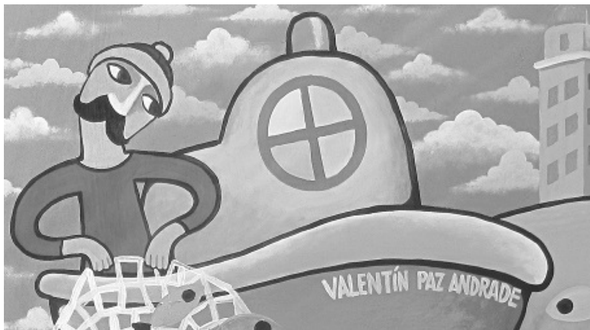
Mural de Leandro Lamas Facultade de Economía e Empresa