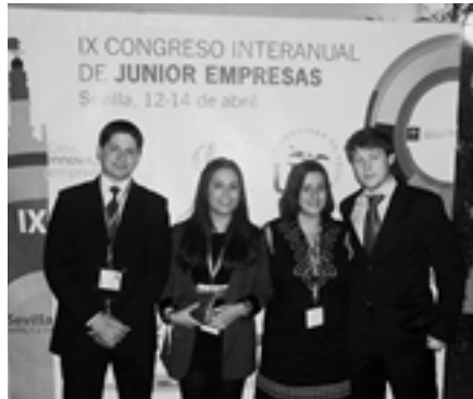
Membros de AECEC no Congreso Interanual de Júnior Empresas en Sevilla e visitando a cidade

A participación no 5.º Encontro Mostra Asociativo Xuvenil (EMAX), en Vilagarcía de Arousa, o pasado mes de outubro, a asistencia ao XXV Aniversario de JEMSA (Santiago de Compostela), o