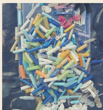
Imaxe real de limpeza da praia de Bens (A Coruña)

MÉRCORES 24 NOVIEMBRE 2021. 19:00H. VÍA TEAMS